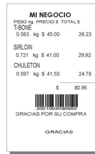
Papel térmico continuo de 56 mm/ 2.2" ya sea con o sin adhesivo.