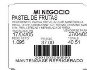
Etiqueta 48 x 38 mm/ 1.8" x 1.49"