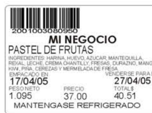
Etiqueta 56 x 40 mm/ 2.2" x 1.57"